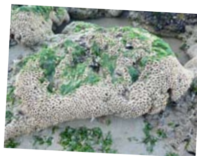
→ Algues vertes sur les hermelles