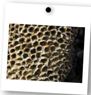
→ Colonie d'hermelles formant un « gâteau d'abeille »