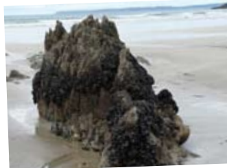
→ Récif d'hermelles en baie de Douarnenez