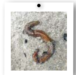
→ La néréide a plein de pattes, comme le mille-pattes.