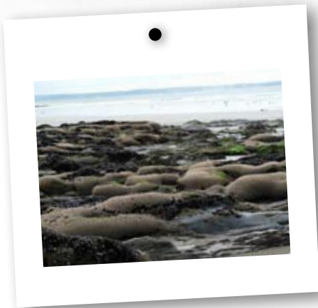
→ Placages d'hermelles en baie de Douarnenez

Les hermelles vivent sur des sols durs, sur les rochers, sur les côtes battues par la mer mais aussi en zone calme. Dans les zones les plus abritées, il s'implante sur des substrats meubles (sables vaseux).