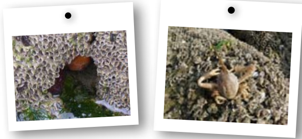
→ Anémones de mer et crabe coryste dans les hermelles

Les scientifiques ont recensé plus de 5000 espèces de polychètes de part le monde... Mais il en existe certainement beaucoup plus ! On distingue deux types de polychètes en fonction de leur mode de vie : les polychètes errants qui se déplacent constamment (tu connais peut-être la néréide ?)