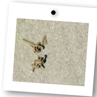
→ Les tortillons qui constellent certaines plages sont l'œuvre de l'arénicole.

→ Les récifs d'hermelles constituent de véritables réservoirs de biodiversité. Grâce aux multiples cachettes qu'ils offrent, ils permettent à beaucoup d'autres organismes marins de vivre et de se développer : des mollusques, des vers polychètes, des anémones de mer, des échinodermes... On y trouve aussi des crevettes, des crabes, des poissons (blennies) qui profitent de l'abri du récif et de ses ressources alimentaires. Un inventaire exhaustif montre que les récifs d'hermelles peuvent abriter jusqu'à 72 espèces différentes. Ils sont aussi très importants pour purifier les eaux, protéger le littoral de l'érosion et produire des larves planctoniques (premier maillon de la chaîne alimentaire).