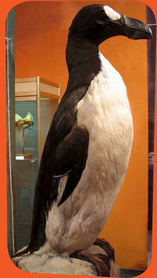
→ Grand pingouin naturalisé

marins sont représentés dont trois grands pingouins. Cela atteste la présence de l'espèce en Méditerranée lors de la dernière glaciation. Seule une dizaine de spécimens empaillés et quelques œufs sont encore conservés dans des muséums à travers le monde.