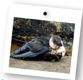
→ Pingouin mazouté à Molène, 2010