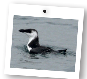
→ Jeune pingouin torda

Malheureusement, elle s'effondre tout aussi rapidement. Aujourd'hui, elle serait à peu près stable avec une trentaine de couples (31 à 33 en 2009). Les Sept-Îles accueillent la plus importante des colonies. Le Cap Fréhel, en Côtes d'Armor, et l'île de Cézembre, en Ille-et-Vilaine, se partagent le reste des effectifs.