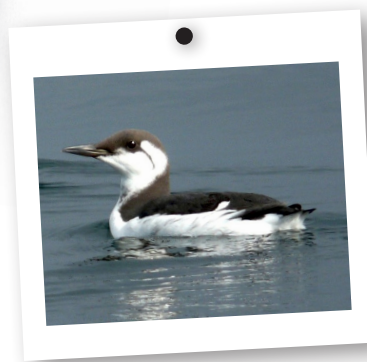
→ Guillemot de troil en hiver

Le macareux moine est très rarement observé. Il est nettement plus petit que les deux autres et difficile à détecter. Un ou deux couples nicheurs subsistent sur Keller (Ouessant). On peut encore le voir facilement autour des Sept-Iles en Côte d'Armor.