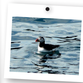
→ Macareux Moine