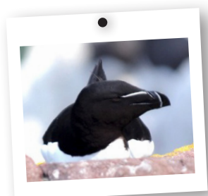
→ Pingouin Torda en plumage nuptial, cap Frehel

Le pingouin torda est grégaire. C'est-à-dire qu'il préfère vivre en groupe. Les couples semblent très unis, certainement jusqu'à la mort d'un des deux. Les pingouins ne font pas de nid. Au tout début du printemps, les adultes rejoignent les sites de nidification. Très sociables, ils partagent volontiers leurs falaises avec le guillemot de troil et la mouette tridactyle. Entre fin avril et début mai, la femelle pond un seul œuf qu'elle dépose directement sur le sol. Après 5 semaines, le poussin éclos. Il est nourri par ses deux parents. Alors qu'il n'a qu'une vingtaine de jour et qu'il ne sait toujours pas voler, il quitte l'abri des rochers et se jette à la mer sous la surveillance de son père. C'est balloté par les vagues qu'il finira de grandir. Vers l'âge de 2 à 3 ans, après avoir parcouru les océans, le jeune adulte reviendra où il est né pour former à son tour une famille.