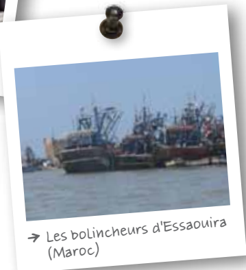
→ Les bolincheurs d'Essaouira (Maroc)