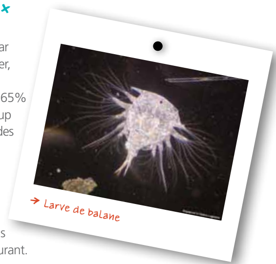
→ Larve de balane

Pour pouvoir se laisser porter par les courants sans couler ni flotter, le plancton est très léger. Il est composé à 95% d'eau (contre 65% dans le corps humain). Beaucoup d'espèces sont dotées de grandes antennes en forme de peigne. D'autres sont très velues ou possèdent de gros flotteurs remplis de liquide ou de gaz. Ces appendices augmentent la surface portante des individus pour pouvoir planer dans le courant.