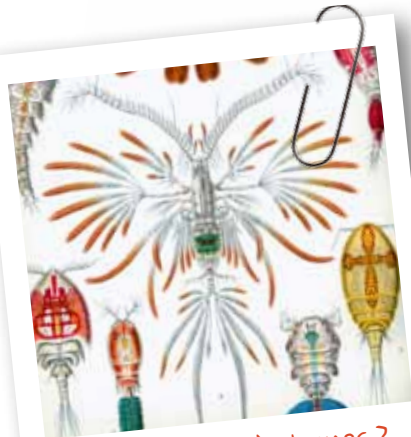
→ Des copépodes à plumes ?

Cela leur permet presque de voler dans le courant... mais sont-ils capables de chanter comme le rouge-gorge ?