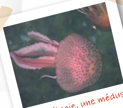
→ La pélagie, une méduse très urticante