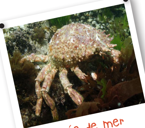
Araignée de mer

→ Un des plus gros crabes, qui ressemble à une araignée, est en train d'envahir l'Europe du Nord ! Les scientifiques commencent à être très inquiets car on ne sait pas jusqu'où il va aller ! C'est le Crabe Royal Rouge de Norvège... Introduit en Russie dans les années 1960, cet animal vorace détruit tout sur son passage... et étend rapidement son empire vers le sud ! Il peut mesurer jusqu'à 1,80 m d'envergure et peser plus de 10 kg ! Espérons qu'on ne le verra pas débarquer en Iroise un jour ! (Source internet Wikipédia)