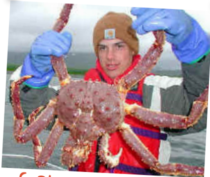
Crabe royal rouge de Norvège